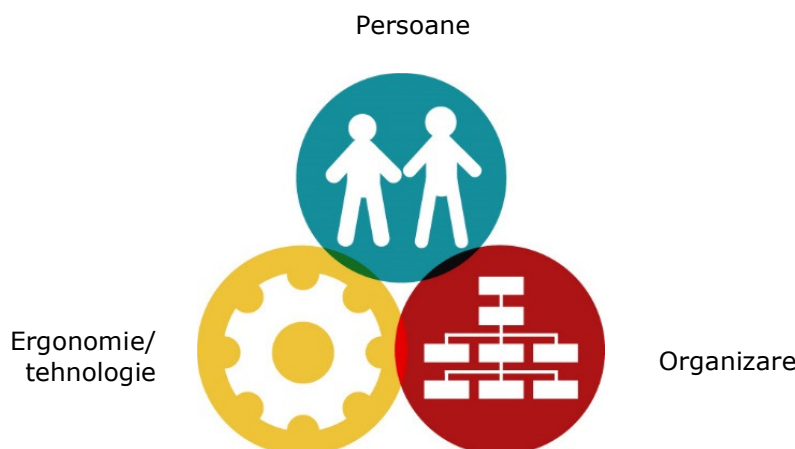
Figura 1. Dimensiunile adaptării locului de muncă la persoană. i

Atunci când se analizează „factorul uman” în cadrul evaluării riscurilor, ar trebui luate în considerare cele trei dimensiuni ale adaptării locului de muncă la persoană (a se vedea figura 1).