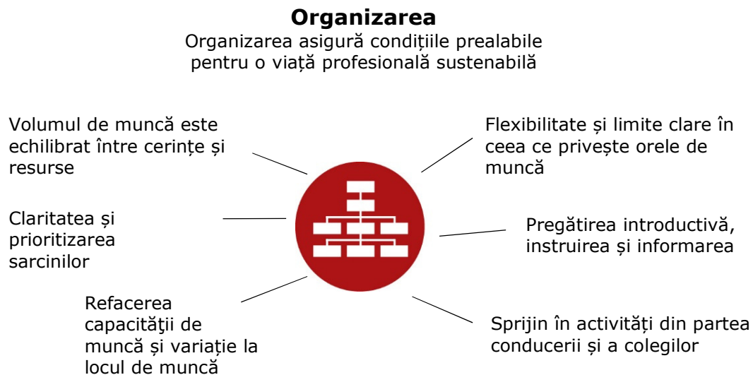
Figura 4. Factori organizatorici. i

Cultura la locul de muncă ar trebui să promoveze angajamentul personalului față de securitate și sănătate și să sublinieze faptul că nerespectarea cerințelor de sănătate și securitate la orice nivel este inacceptabilă. Cultura organizatorică influențează puternic comportamentul uman și poate fi esențială în determinarea stării de bine la locul de muncă a grupurilor sensibile de lucrători expuși unor riscuri specifice, precum riscurile psihosociale, agresivitatea și hărțuirea (a se vedea figura 4).